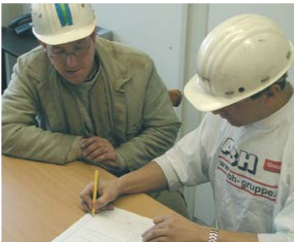
Bild 2-8: Gemeinsames Festlegen der zu treffenden Sicherheitsmaßnahmen

Der Verantwortliche der Fremdfirma muss sich deshalb vor Beginn der Arbeiten mit dem Auftragsverantwortlichen in Verbindung setzen und eine Gefährdungsbeurteilung am zukünftigen Arbeitsplatz durchführen. Die abgestimmten Sicherheitsmaßnahmen werden schriftlich fixiert (Beispiel Anhang 4) und liegen bei der Auftragsausführung vor.