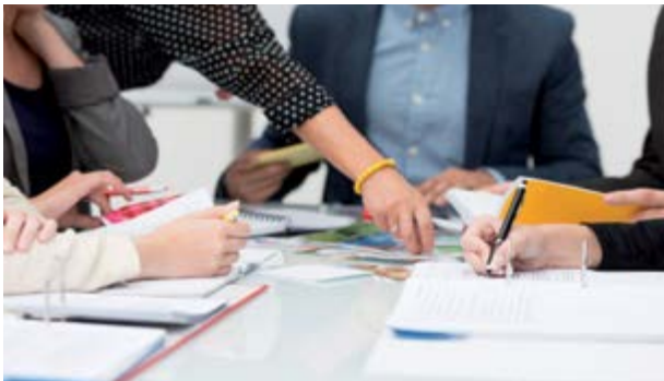
Bild 2-7: Unterweisen der Mitarbeiter durch den Verantwortlichen der Fremdfirma

Werden von der Fremdfirma nicht ausreichend der deutschen Sprache mächtige Mitarbeiter eingesetzt, muss die Fremdfirma gewährleisten, dass diese Mitarbeiter die Arbeitsschutzbestimmungen eindeutig verstehen.