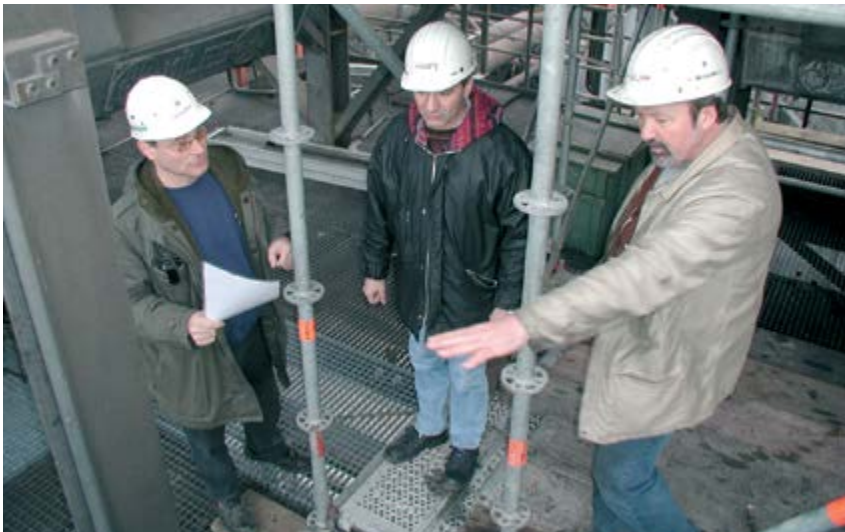
Bild 2-4: Gemeinsame Ermittlung von Gefährdungen (Auftragsverantwortlicher, Verantwortlicher der Fremdfirma, zuständiger Meister)

Abgestimmte Sicherheitsmaßnahmen sollten schriftlich fixiert werden und bei der Auftragsausführung vor Ort vorliegen.