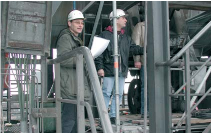
Bild 2-2: Einweisung des Verantwortlichen der Fremdfirma durch den Auftragsverantwortlichen

Die Einweisung sollte in einem Protokoll dokumentiert werden (Beispiel Anhang 3). Im Einweisungsprotokoll wird ausdrücklich auf die Pflicht des Verantwortlichen der Fremdfirma hingewiesen, dass dieser die zum Einsatz kommenden Mitarbeiter der Fremdfirma nachfolgend zu unterweisen hat.